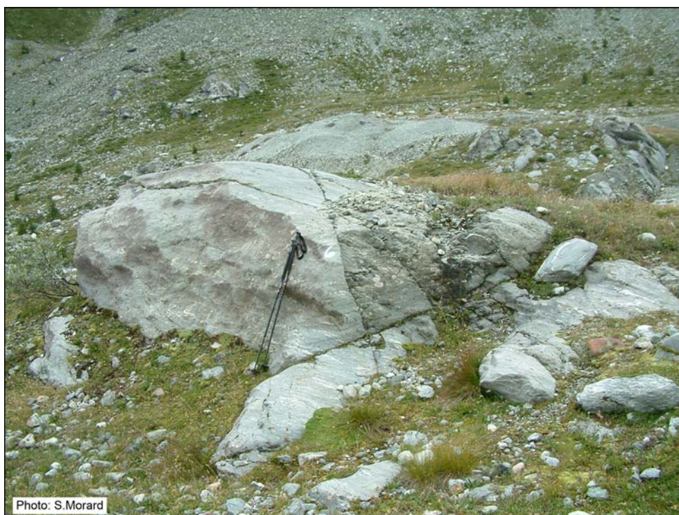
Fig. 3 – Morphologie dissymétrique des roches moutonnées du Turtmanntal (VS) due au polissage et à l'arrachement. Ecoulement du glacier de la droite vers la gauche.