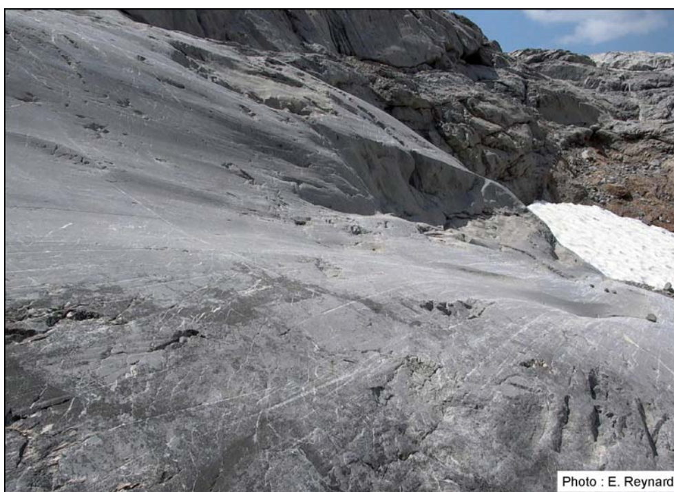
Fig. 4 – Stries et roches moutonnées sur calcaire au Lapis de Tsanfleuron (Col du Sanetsch, VS).