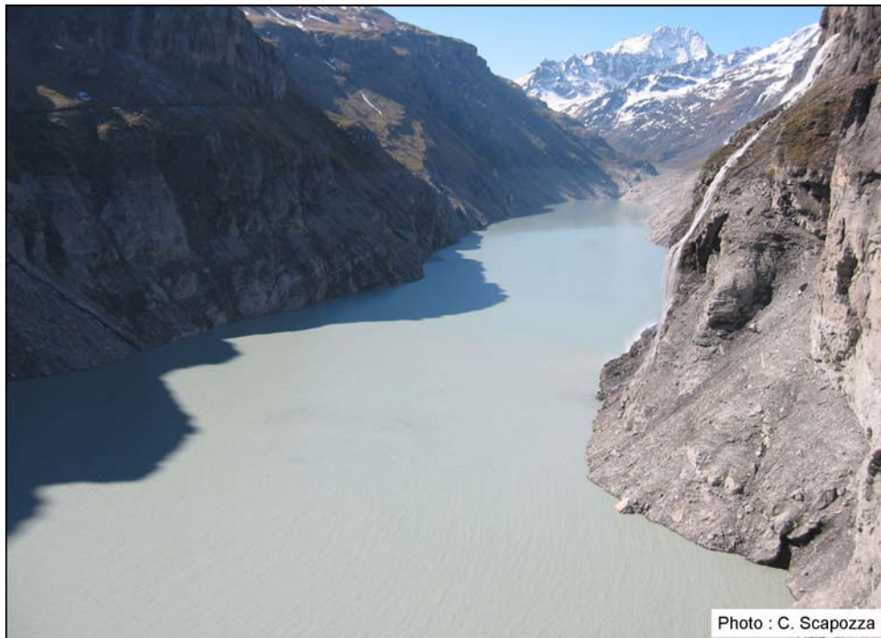
Fig. 1 – L'actuel lac de Mauvoisin, au fond du Val de Bagnes (VS).