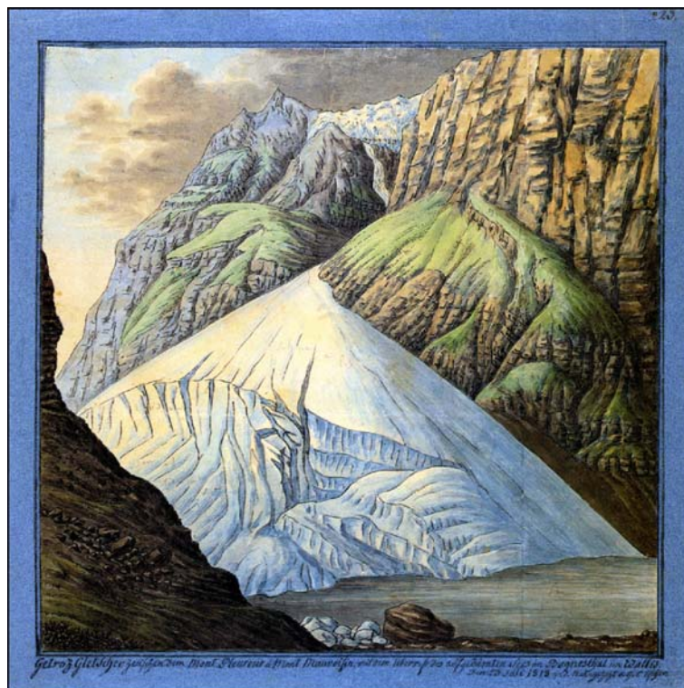
Fig. 2 – Le glacier du Giétro entre le Mont Pleureux et le Mont Mauvoisin, avec les restes du lac glaciaire (Val de Bagnes, VS), dessiné d'après nature par H. C. Escher le 23 juillet 1818. Dessin à plume, aquarelle, 26 x 26,5 cm, Graphische Sammlung, ETH Zurich (n° 223 = Inv. C XII 13b).